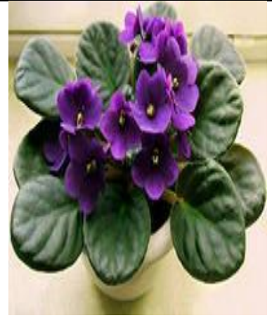
Фиалки с разной окраской цветков