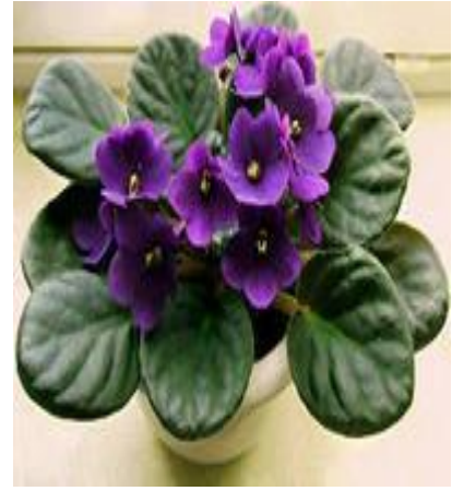
Фиалки с разной окраской цветков