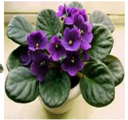
Фиалки с разной окраской цветков