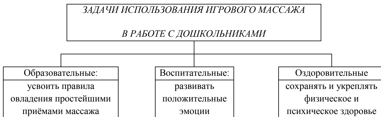
Рис. Задачи использования игрового массажа в работе с дошкольниками

Все задачи использования игрового массажа в работе с дошкольниками можно разделить на три группы – образовательные, воспитательные и оздоровительные (см. рис.).