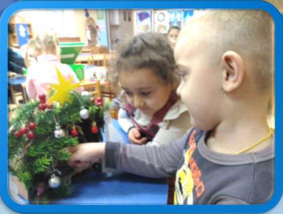
Изготовление Рождественского вертепа