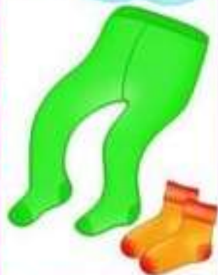
КОЛГОТКИ И НОСКИ